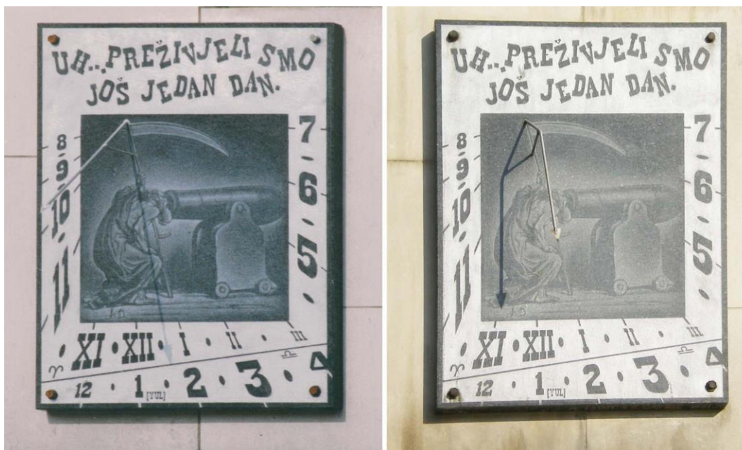
Slika 2. Sunčani sat na zgradi ZOI fotografisan za vrijeme jesenje ravnodnevice 1991. godine (lijevo) i danas, poslije trideset godine. Sjenka danas pokazuje, ništa.

Nažalost, crne slutnje su se obistinile, na prostoru bivše Jugoslavije izbio je rat u kome niko nije bio pošteđen, i ništa nije bilo pošteđeno, pa čak ni sunčani satovi. Prije rata Sarajevo je bilo grad sa najviše zidnih sunčanih satova u bivšoj Jugoslaviji. Netragom su nestali sunčani sat na kamenorezačkoj radnji „Miro Šego”, sunčani sat zgrade na Bentbaši u kojoj je donedavno bila smještena ambasada Slovenije, sunčani sat vile s početka XX vijeka u aleji ka Vrelu Bosne, i sunčani sat na biblioteci „Vlatko Foht”. Ostali su samo sunčani sat na „novoj” zgradi PMF-a i razmatrani sunčani sat na zgradi ZOI, ali ni jedan nije više u funkciji – prvi je potpuno zaklonjen naknadno zasađenim drvećem, a kod drugog je šipka iskrivljena tako da sjenka ne pokazuje tačno vrijeme (sl. 2).